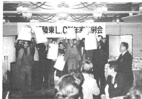
うれし、はずかし顔をかくしての授賞