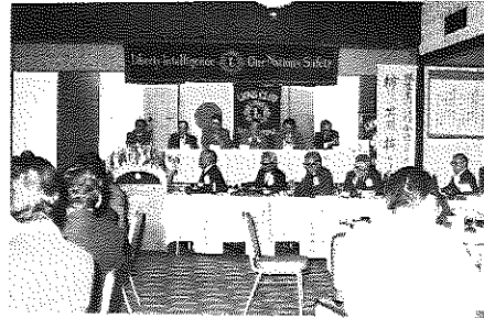
第291回 公式訪問例会でのパネルディスカッション 人生航路はいかに？