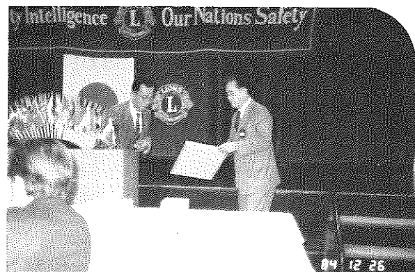
寝た切り老人へ、愛のシルバーテレフォンプレゼント アクティビティー