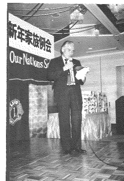
区、Cの熟演 ヨー大統領