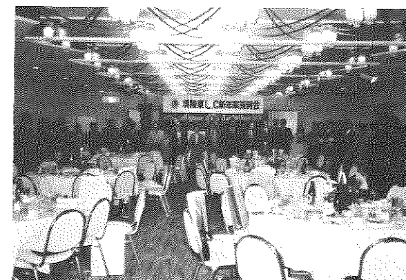
大きい輪、楽しい輪 今年も楽しくライオン活動