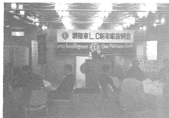
心新たに 会長新年の挨拶