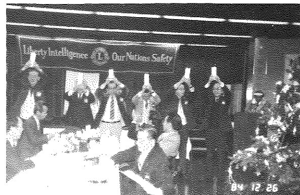
クリスマス例会でカーちゃんの誕生祝 もらってニコリ、ウォー