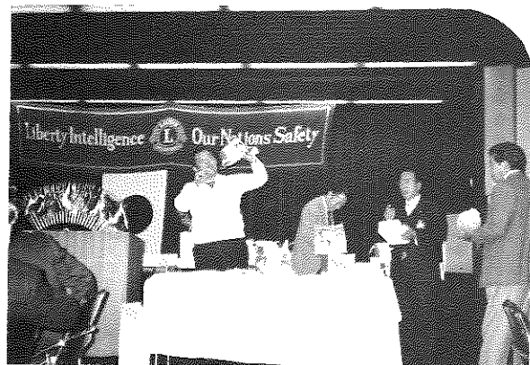
堺陵東L.C名物 セリ市風景 サア一買うて、此の鍋でうまいもん煮てやア