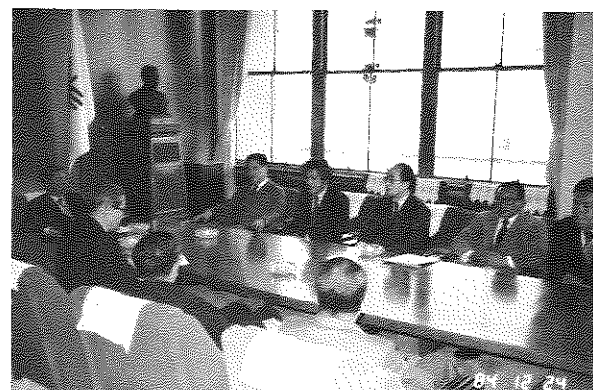
堺市長へ 堺陵東メンバー奉仕の訪問