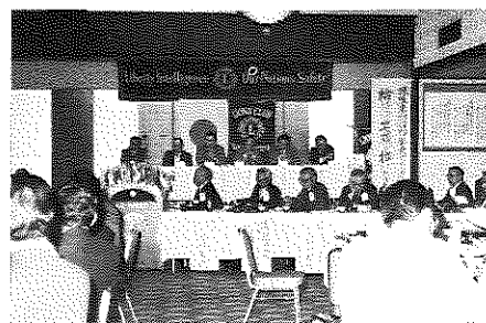
第291回 公式訪問例会でのパネルディスカッション 人生航路はいかに？