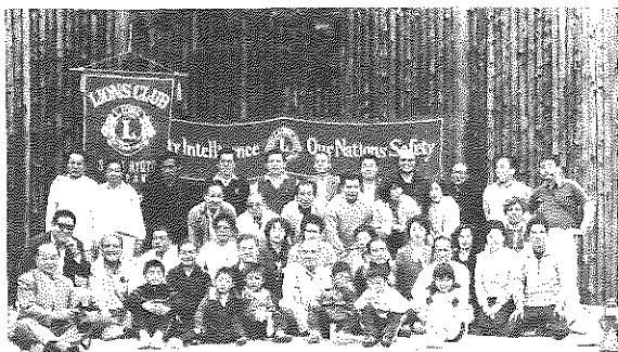
第290回 体育の日六甲山において、体力増強家族例会全員集合!!