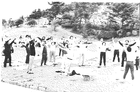
みんなで仲良くオイッチニーオイッチニー、無理するなヨ