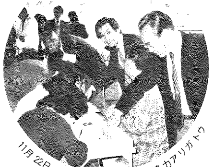
11月22日 愛の献血運動、皆様ご協力アリガトウ