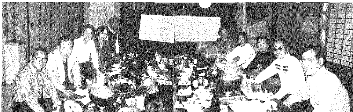
雨の中でのゴルフの後 楽しい表彰式前 どの方優勝? どの方B.B.