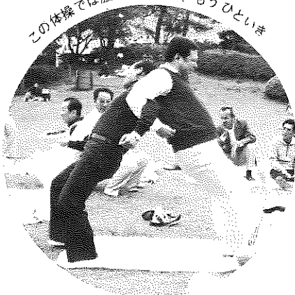
この体験では腹が出る出る、もうひととき