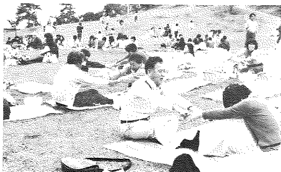
チョットチョット、おがあちゃんあまり力を入れないでヨ