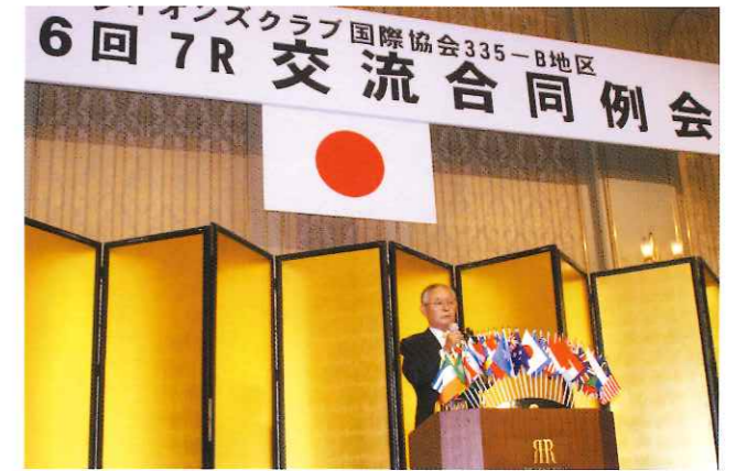
第6回 7R 交流合同例会

会長、役員の皆様方初めメンバーの方々の変らぬ御支援、御指導を心よりお願い申し上げます、私の抱負といたします。