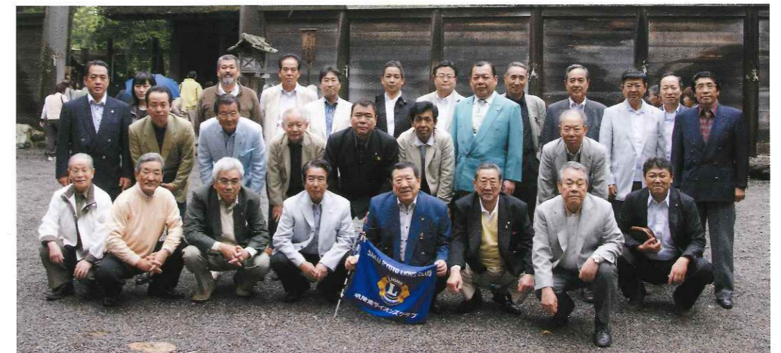
一泊例会（伊勢神宮）

それから、堺陵東ライオンズクラブにおいても、先輩のアドバイスの下で自分に出来る範囲で頑張っていきたいと思っておりますのでこれからも宜しく御願致します。