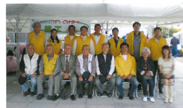
堺まつり竹細工コーナー