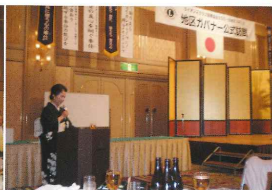
ガバナー公式訪問（出席率100%!!）