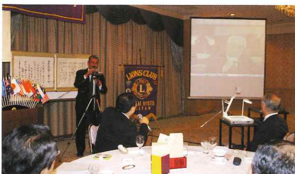
波佐見 LC 合同テレビ例会