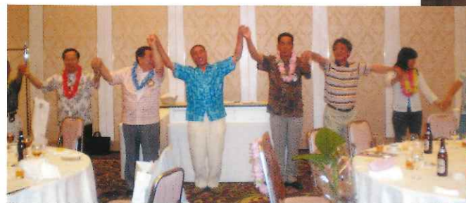
納涼例会（また合う日まで♪）