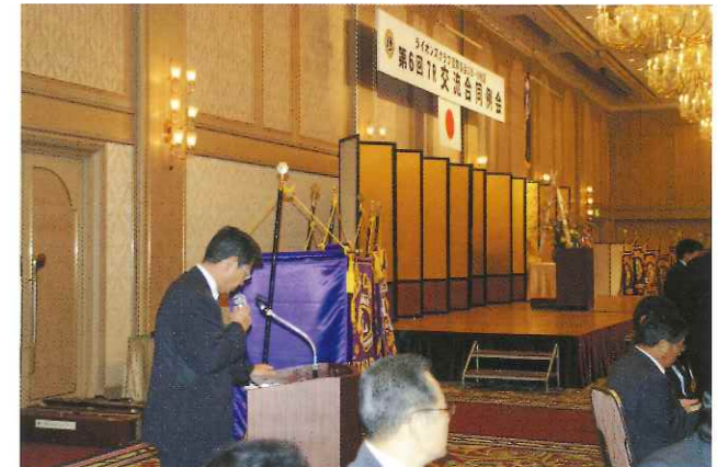
第6回 7R交流合同例会

会長の手足となりメンバー参加型のアクティビティーを主にとの会長方針 共に喜び共に培う心の奉仕に従って前向きに皆様のご理解ご指導の上一生懸命がんばりますので宜しくお願いします。