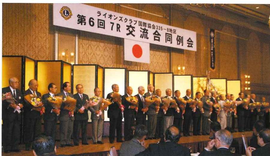
7 R 合同例会（長寿のお祝い）