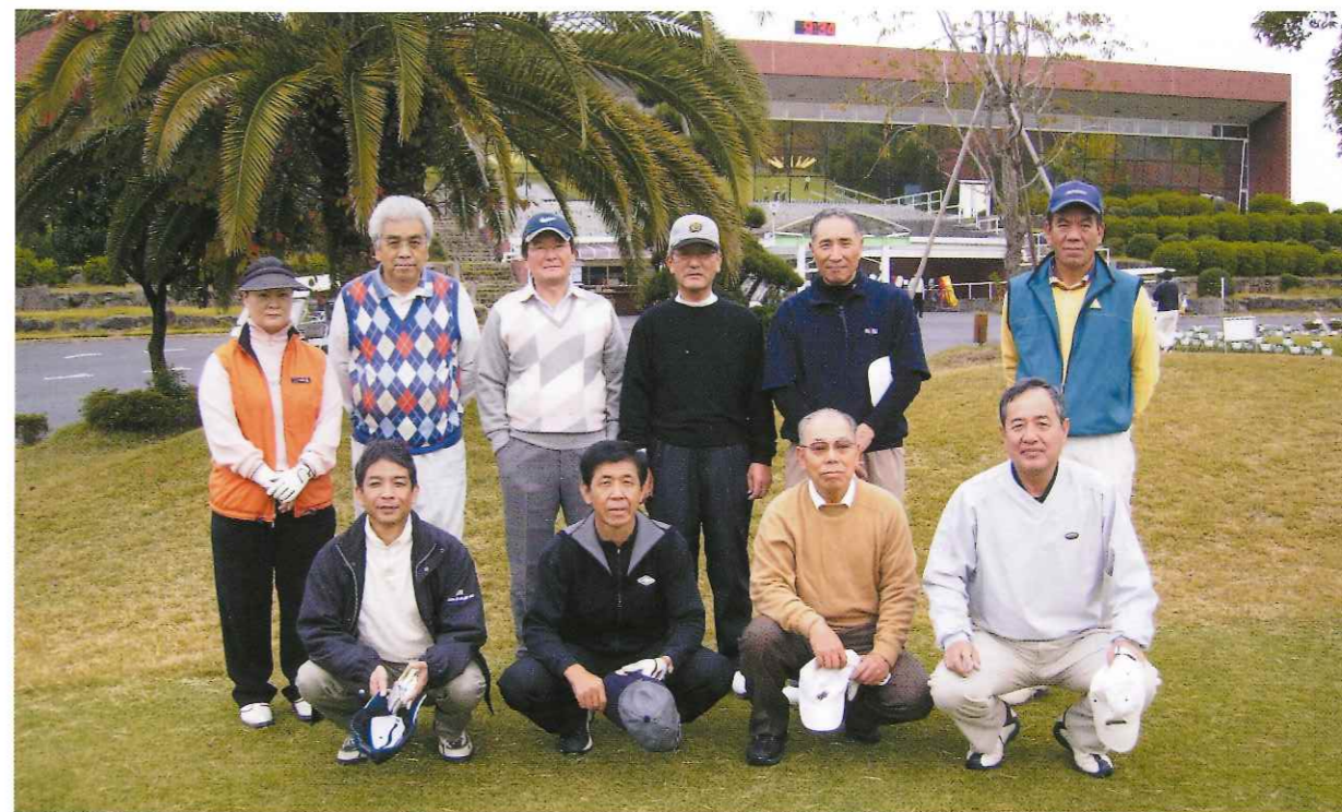
今期第1回ゴルフコンペ 泉ヶ丘CCにて