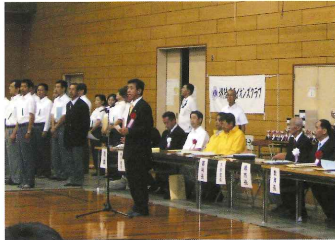
堺市長杯争奪少年剣道選手権大会

私が当クラブに入会して、早や十年に成りますが、諸先輩の方々から受け継ぎましたライオンニズムの精神を尊重しつつクラブ員全員と、共に助け合い、共感の精神をもってテーマ完遂に全力を注いで行きたいと考えております。私一人の力では、あまりにも微力でありこの一年間皆様方の絶大なるご協力とご支援をお願い申し上げまして私の会長の就任の挨拶とさせていただきます。