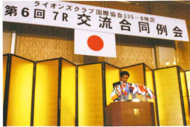
第6回 7R交流合同例会

また、奉仕活動の中から、成長された次世代の方々が続いて行ってくれる様な活動に成るようにもして行きたいと考えております。