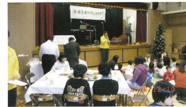
泉ヶ丘学院クリスマス