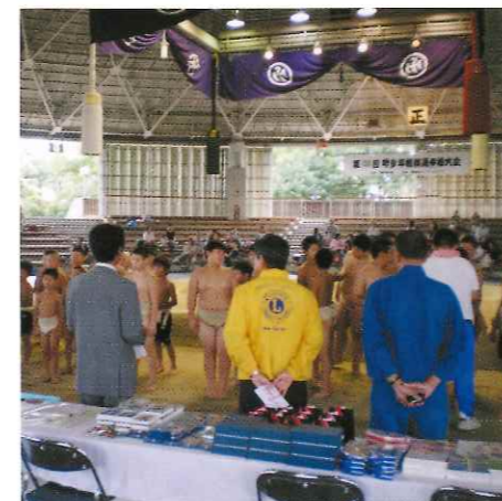
堺少年相撲選手権大会