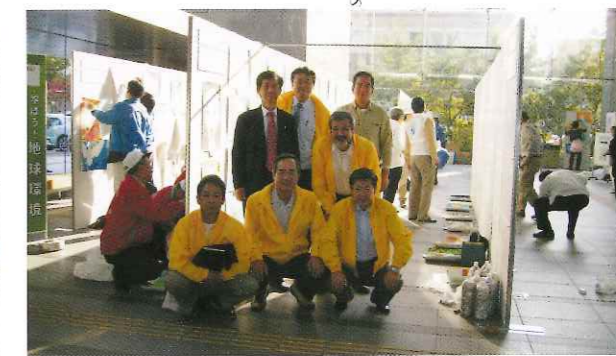
平和ポスターコンテスト