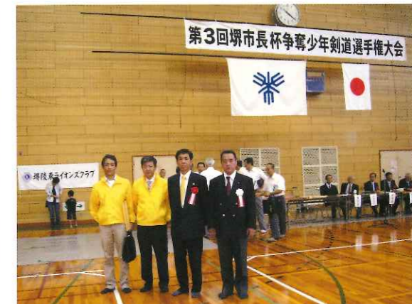
堺市長杯争奪少年剣道選手権大会