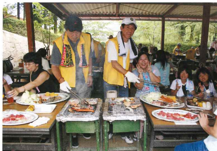
母子寡婦会（バーベキュー）

11月には、例年通り福祉バザーに参加しました。今回もメンバーの協力により、多くの商品を集めることができました、メンバーの中には、プロではないかと思えるほど、口の達者の者も数名見受けられました。何とか今年も目標の売り上げをクリアすることが出来ました。