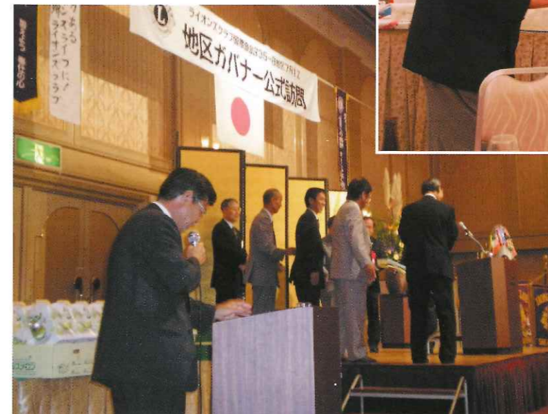
ガバナー公式訪問