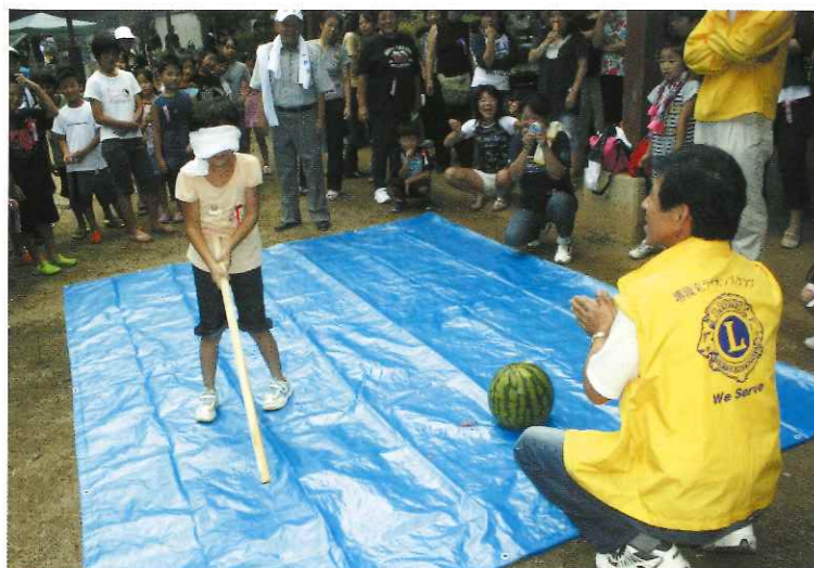
母子寡婦会（スイカ割り）