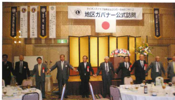
ガバナー公式訪問（輪になって）